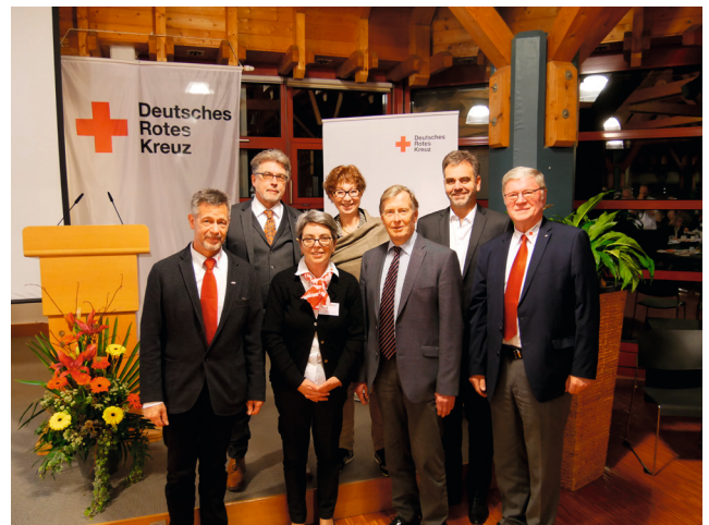
Am 22. November 2019 gewähltes Präsidium