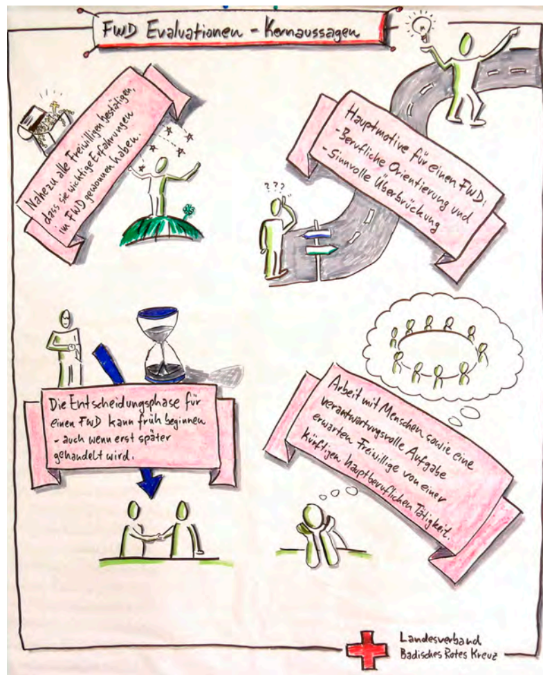
© Uli Leonhardt, Badisches Rotes Kreuz