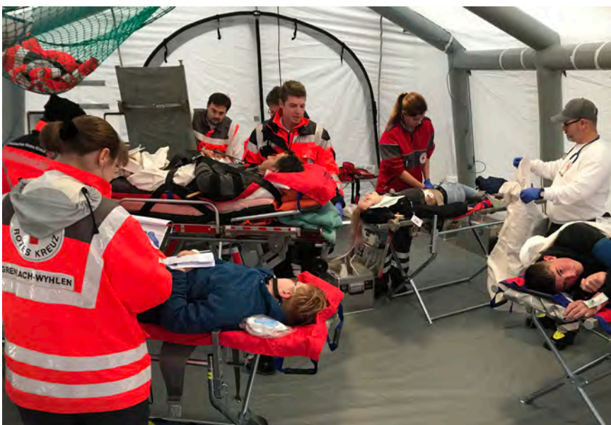
Notfallübung am Katzenbergtunnel

Den Kreisverbänden wird hier von Seiten der Fachgruppe des Landesverbandes angeboten, sie bei der Beschaffung der notwendigen Ausstattung für Trinkwassertransporte und der Qualifizierung der Ehrenamtlichen zu unterstützen.