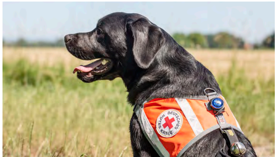
Die Rettungshundestaffeln waren bei 61 Sucheinsätzen aktiv