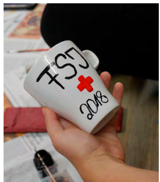
Ein FSJ lohnt sich