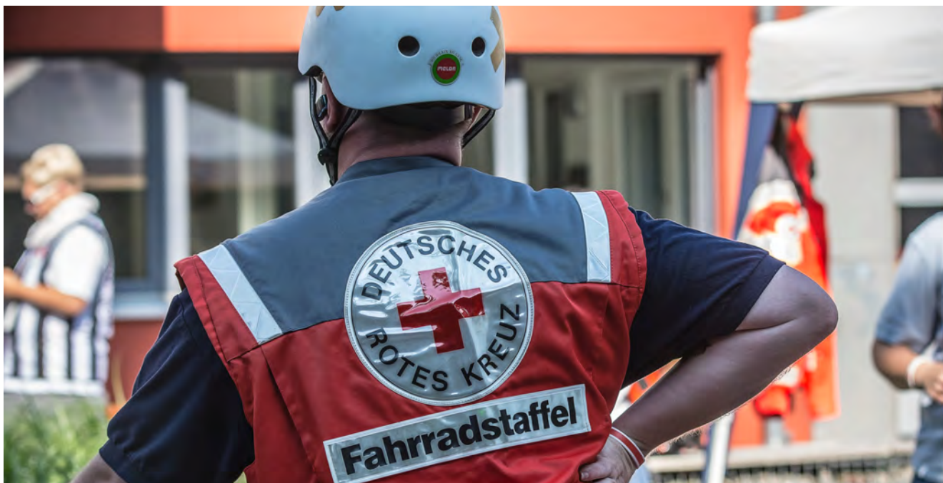
Landeswettbewerb in Hornberg