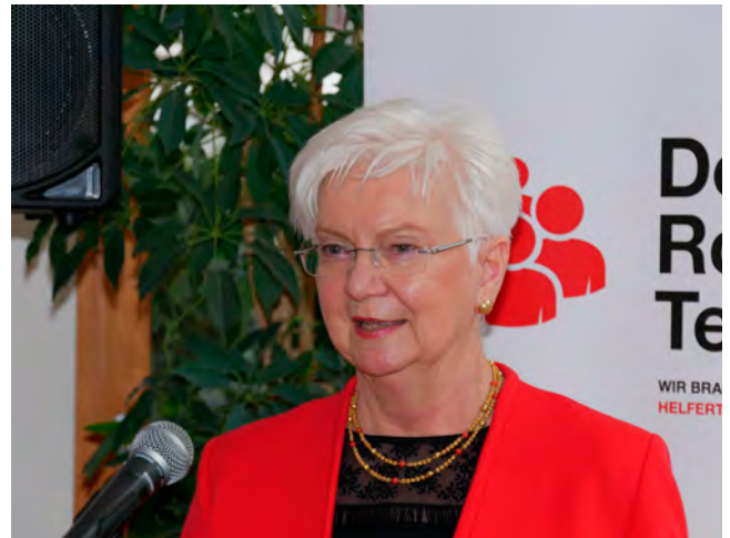
Präsidentin Gerda Hasselfeldt

Der Südwestrundfunk (SWR) widmete dem Rettungsdienst einen ganzen Thementag und sendete im Fernsehen wie im Radio Reportagen, Features und Hintergrundberichte. Thematisiert wurden unter anderem steigende Einsatzzahlen, der Personalengpass im Rettungsdienst sowie das sich immer weiter verändernde Gesundheitssystem und die Aus-