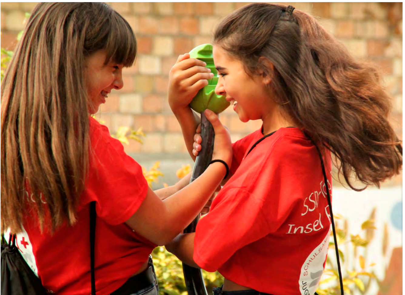
Engagiert für mehr Menschlichkeit: Schülerinnen beim SSD-Tag auf der Reichenau

Das ist das Recht der Jugend: Dinge anders machen.