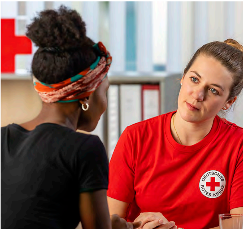
Die Migrationsberatung wird weiter ausgebaut