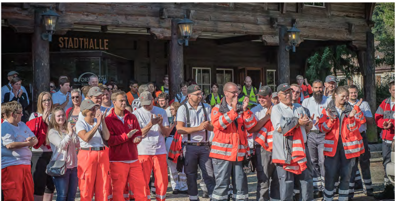
Gleich geht's los: Landeswettbewerb 2018 in Hornberg

Eine anstehende strukturelle Veränderung in der Abteilung Hilfgesellschaft/Rettungsdienst wurde 2018 zum Anlass genommen, alle Funktionsstellen, die mit Ehrenamt betraut sind, in einer Abteilung, den „Rotkreuzdiensten“ zusammenzufassen. Die Entscheidung erwies sich schon nach kurzer Zeit als richtig. Eine gemeinsame Abteilungsleitung, eine gemeinsame Besprechungsstruktur und dadurch eine gemeinsame Plattform für alle Fragen zur ehrenamtlichen Arbeit erleichtern die Arbeit und geben ihr mehr Substanz und Qualität. Alles aus einem Guss eben.