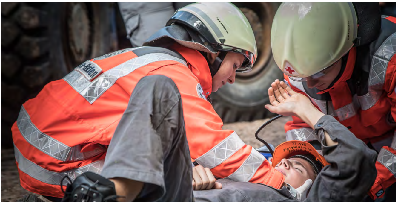
Die Teams zeigen hohen Ausbildungsstand beim Landeswettbewerb

In den gesamten Prozess eng eingebunden waren die Berufsgenossenschaften, die beispielsweise auch die neu entwickelten Lehrpläne begutachteten.