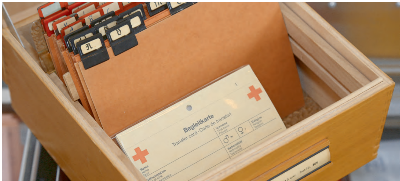
Auch im Zeitalter der Digitalisierung ist die Karteikarte unverzichtbar